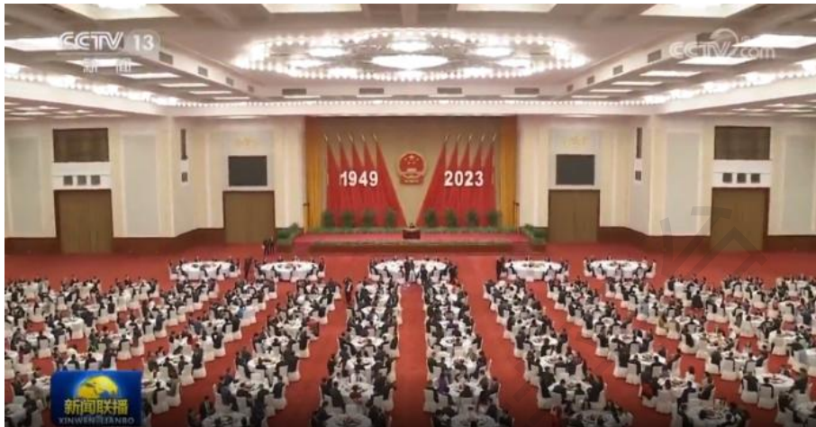
（央视新闻频道报道国庆招待会）

族迎来了从站起来、富起来到强起来的伟大飞跃。进入新时代，在以习近平同志为核心的党中央坚强领导下，党和国家事业取得历史性成就、发生历史性变革，为实现中华民族伟大复兴提供了更为完善的制度保证、更为坚实的物质基础、更为主动的精神力量。