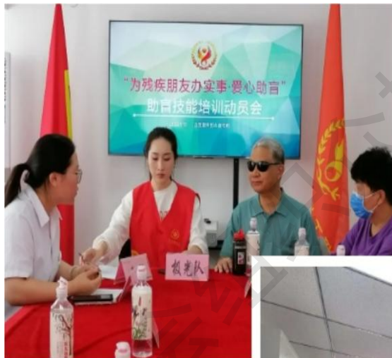
爱心助盲动员宣传会

据了解，我会会员服务部还将进一步在慈善义工和社会爱心人士中开展“爱心助盲”专业技能培训，通过培训，让更多人掌握助盲技能、参与助盲服务，共同营造关注盲人、关爱盲人、服务盲人的良好社会氛围。